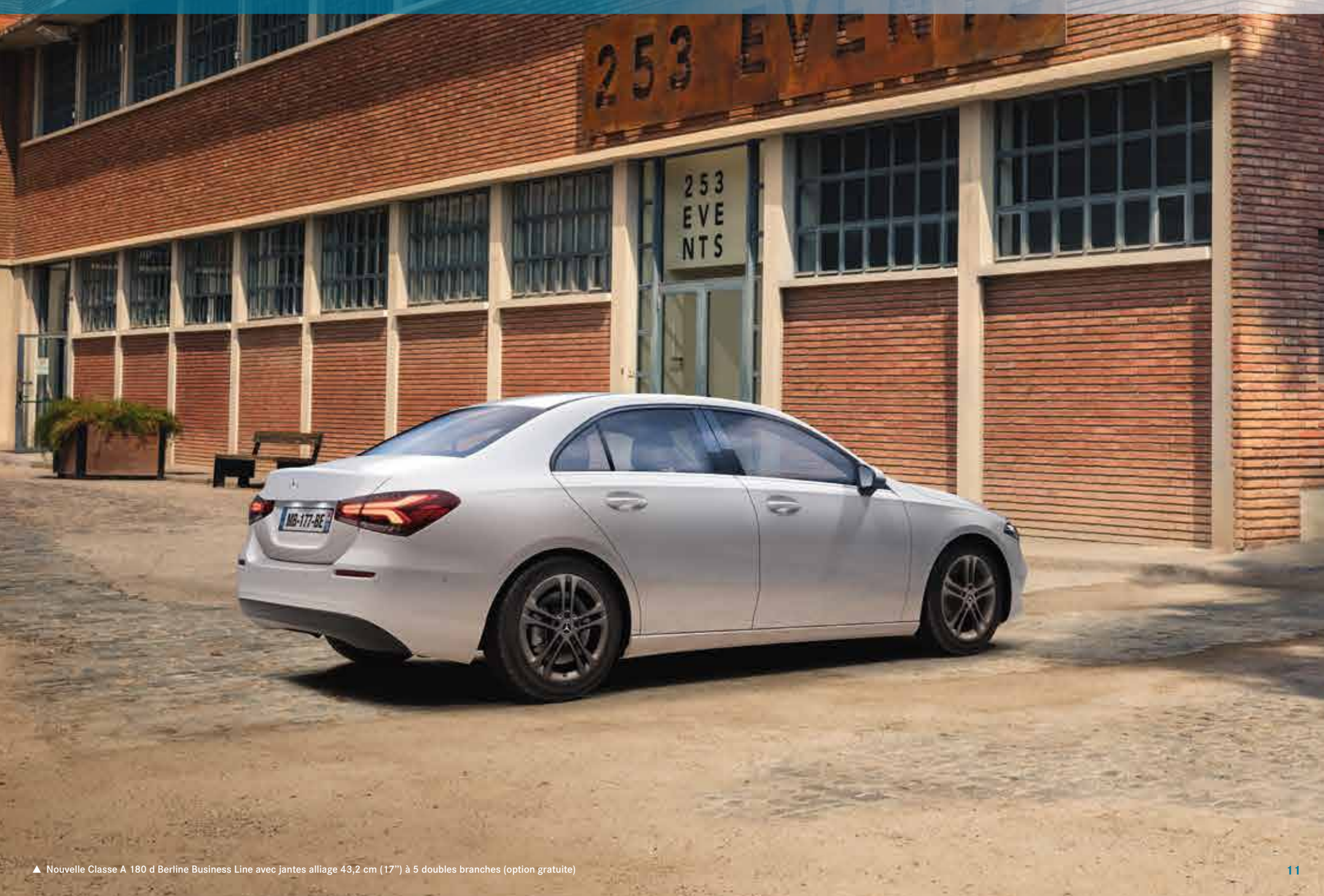
▲ Nouvelle Classe A 180 d Berline Business Line avec jantes alliage 43,2 cm (17") à 5 doubles branches (option gratuite)