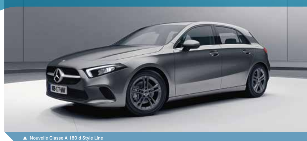
▲ Nouvelle Classe A 180 d Style Line