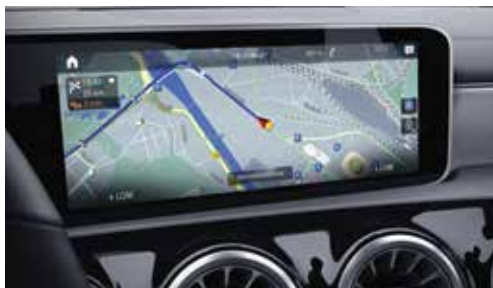
▲ Ecran central 10" avec technologie tactile et système de navigation Mercedes-Benz