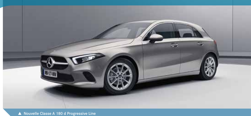
▲ Nouvelle Classe A 180 d Progressive Line

Pour connaître le détail des garnitures en cuir, veuillez vous reporter à la rubrique Peintures et Garnitures