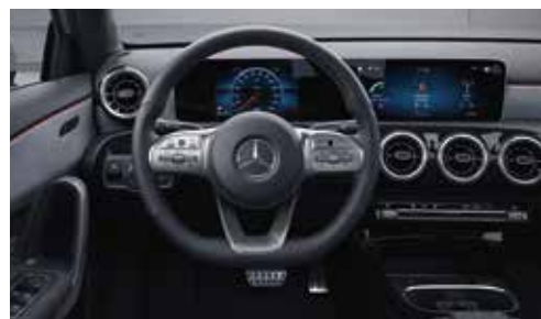
▲ Volant sport multifonctions en cuir Nappa