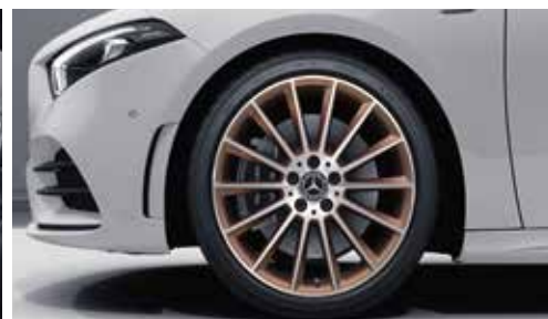
▲ Jantes alliage AMG 48,3 cm (19") multibranches en finition cuivre et rebord brillant