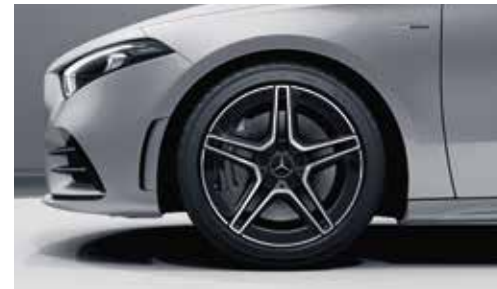
▲ Jantes alliage AMG de 45,7 cm (18") à 5 doubles branches