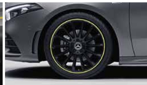
▲ Jantes alliage AMG 48,3 cm (19") multibranches (RV1)