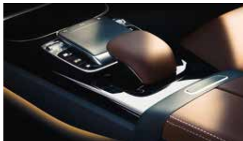
▲ Pavé tactile TOUCHPAD