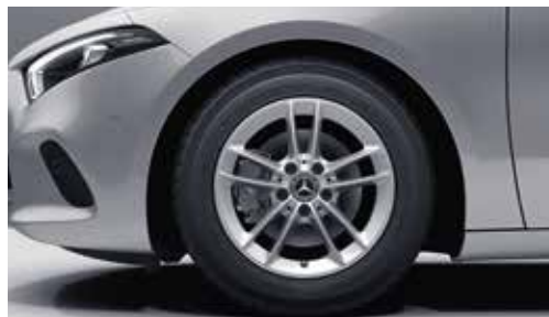
▲ Jantes alliage 40,6 cm (16") à 5 doubles branches