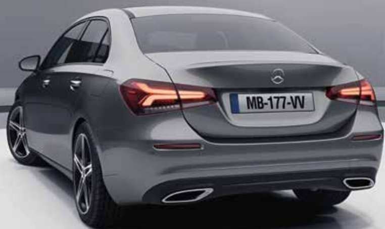
▲ Nouvelle Classe A 200 Berline Progressive Line avec Projecteurs MULTIBEAM LED (642) et Pack Sport Black (P55)