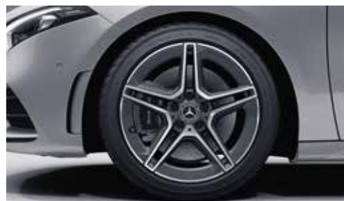
▲ Jantes alliage AMG 45,7 cm (18") à 5 branches