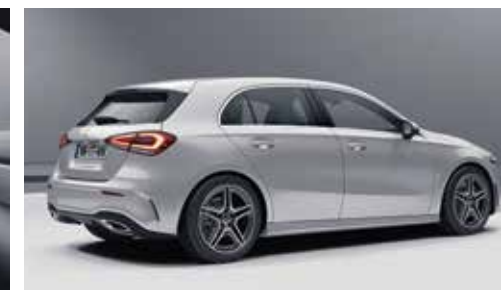
▲ Kit carrosserie AMG avec diffuseur arrière et sorties d'échappement chromées