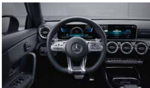
▲ Volant performance AMG en cuir Nappa