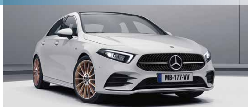
▲ Nouvelle Classe A 200 Berline Edition 1 avec toit ouvrant panoramique (413)