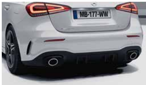
▲ Sorties d'échappement rondes chromées de 90 mm de diamètre