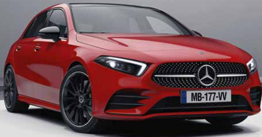
▲ Pack Sport Black (P55) avec jantes alliage AMG 48,3 cm (19") en Y (RVK), Toit ouvrant panoramique (413) et Projecteurs MULTIBEAM LED (642)