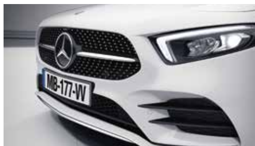
▲ Grille de calandre diamant avec pastilles cuivre, lamelle peinte en noir et insert chromé