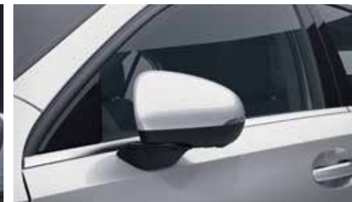
▲ Rétroviseurs extérieurs rabattables électriquement