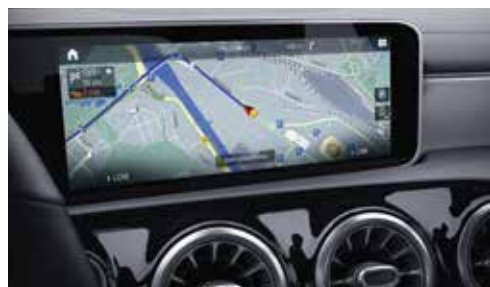
▲ Système de navigation Mercedes-Benz