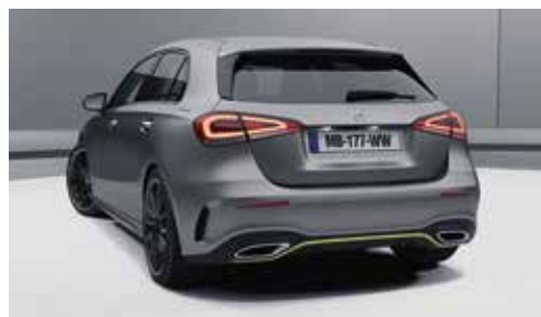
▲ Baguette arrière jaune