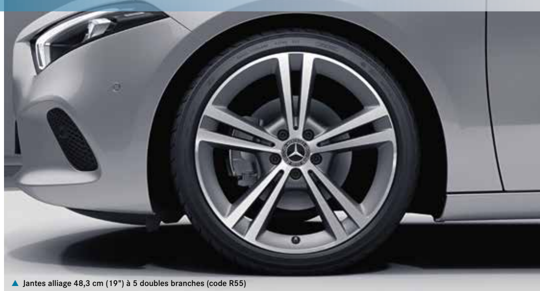
▲ Jantes alliage 48,3 cm (19") à 5 doubles branches (code R55)