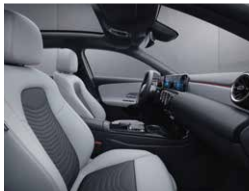
▲ Tissu/similicuir ARTICO noir/gris (371A), sièges confort