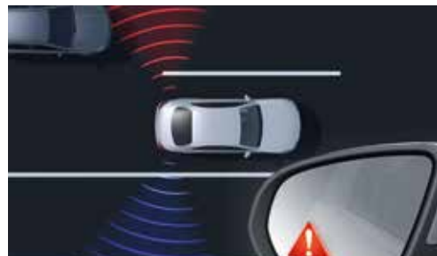
▲ Avertisseur d'angle mort