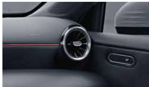
▲ Buses de ventilation avec cerclage chromé et insert rouge