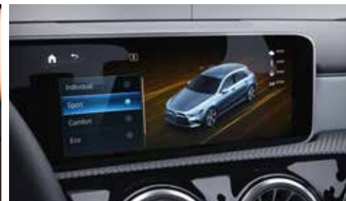
▲ Dynamic Select