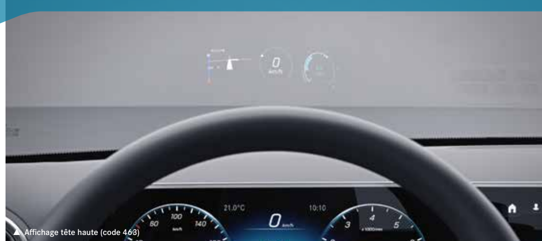
▲ Affichage tête haute (code 463)