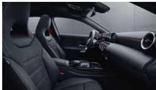
▲ Sièges sport avec garnitures en similicuir ARTICO/DINAMICA noir et surpiqûres rouges