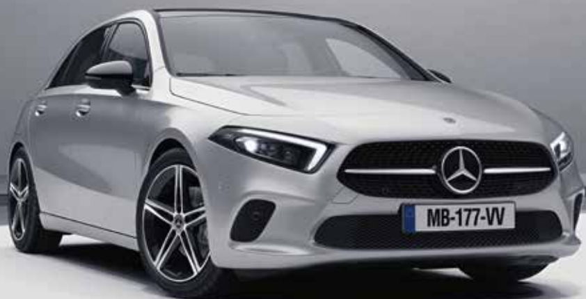
▲ Nouvelle Classe A 200 Berline Progressive Line avec Projecteurs MULTIBEAM LED (642), Toit ouvrant panoramique (413) et Pack Sport Black (P55)