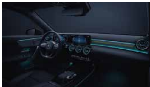
▲ Eclairage d'ambiance