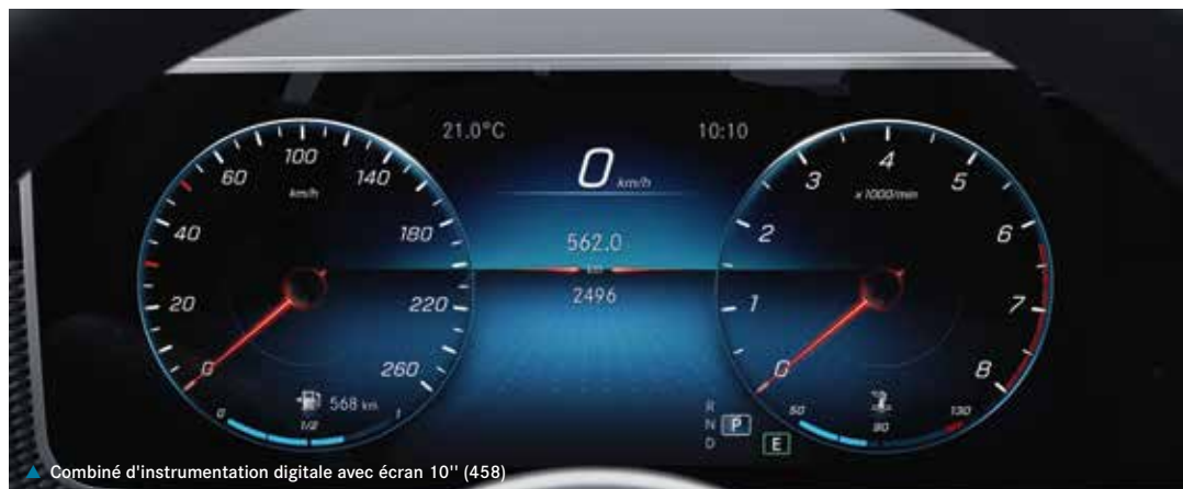
▲ Combiné d'instrumentation digitale avec écran 10" (458)