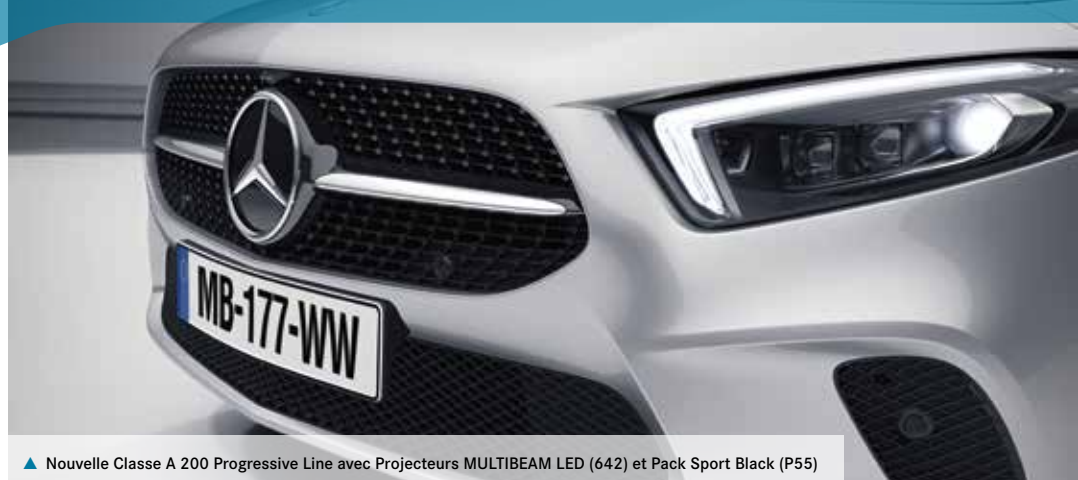
▲ Nouvelle Classe A 200 Progressive Line avec Projecteurs MULTIBEAM LED (642) et Pack Sport Black (P55)