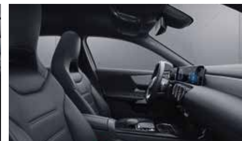
▲ Garnitures intérieures en Similicuir ARTICO / microfibre DINAMICA