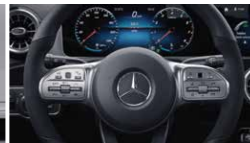
▲ Volant sport multifonction à 3 branches en cuir Nappa