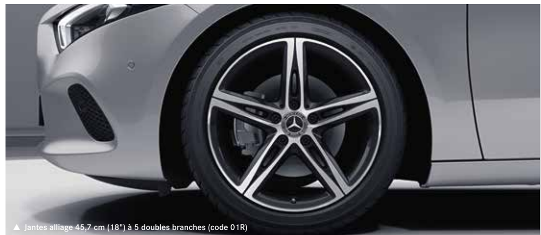
▲ Jantes alliage 45,7 cm (18") à 5 doubles branches (code 01R)