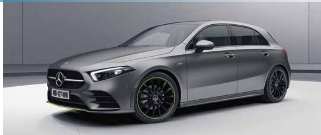
▲ Nouvelle Classe A 180 d Edition 1 avec Toit ouvrant panoramique (413)