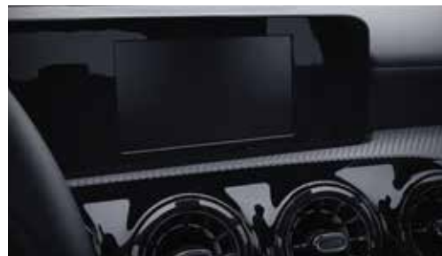
▲ Ecran multimédia 7" avec technologie tactile