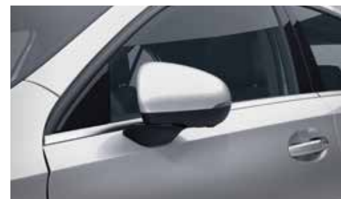
▲ Rétroviseurs extérieurs rabattables électriquement