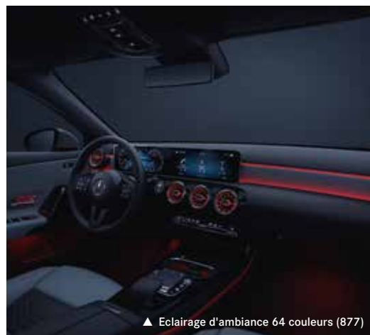
▲ Eclairage d'ambiance 64 couleurs (877)