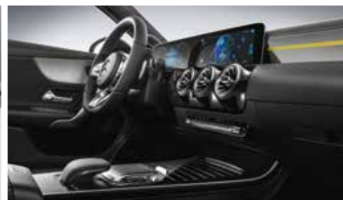
▲ Inserts décoratifs en aluminium clair à stries longitudinales (H44)