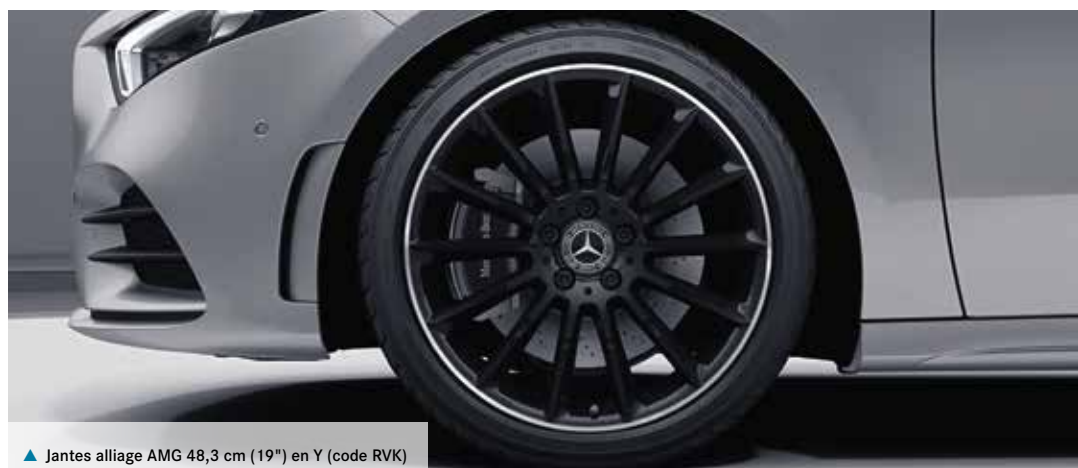
▲ Jantes alliage AMG 48,3 cm (19") en Y (code RVK)