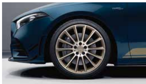
▲ Jantes alliage AMG 48,3 cm (19") multibranches, peintes Tech Gold mat et naturel brillant