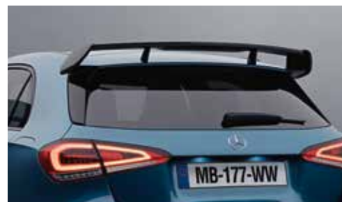
▲ Aileron arrière AMG en finition noir brillant