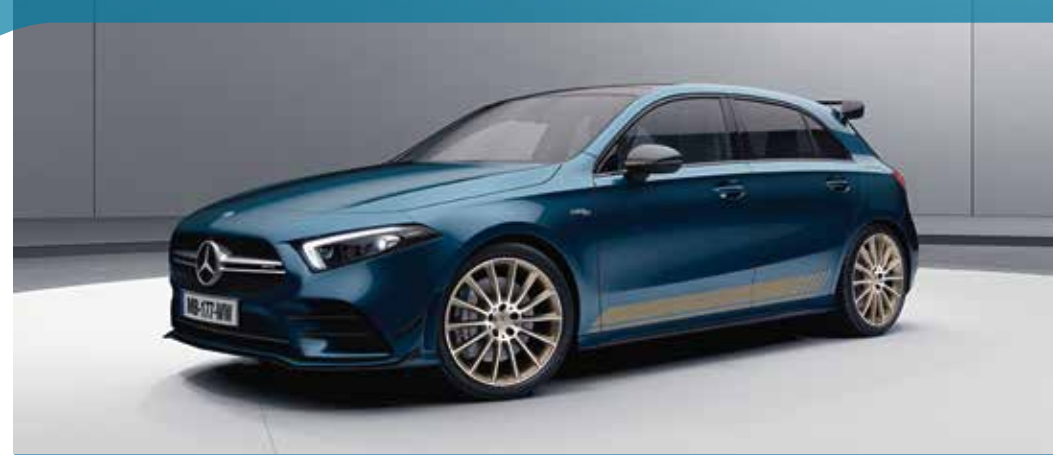
▲ Nouvelle Mercedes-AMG A 35 4MATIC