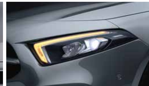
▲ Projecteurs LED Hautes performances