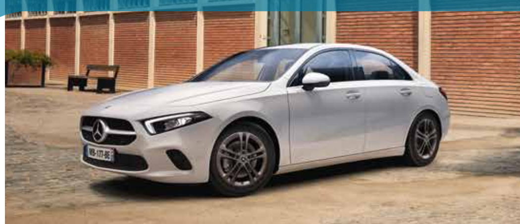
▲ Nouvelle Classe A 180 d Berline Business Line avec jantes alliage 43,2 cm (17") à 5 doubles branches (option gratuite)