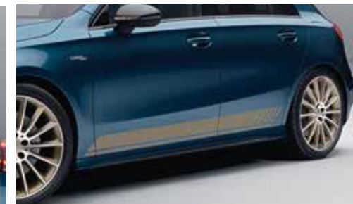
▲ Allure sportive avec le sticker "Tech Gold mat"