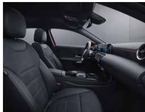
▲ Similicuir ARTICO/DINAMICA noir (651A), sièges sport Classe A Berline