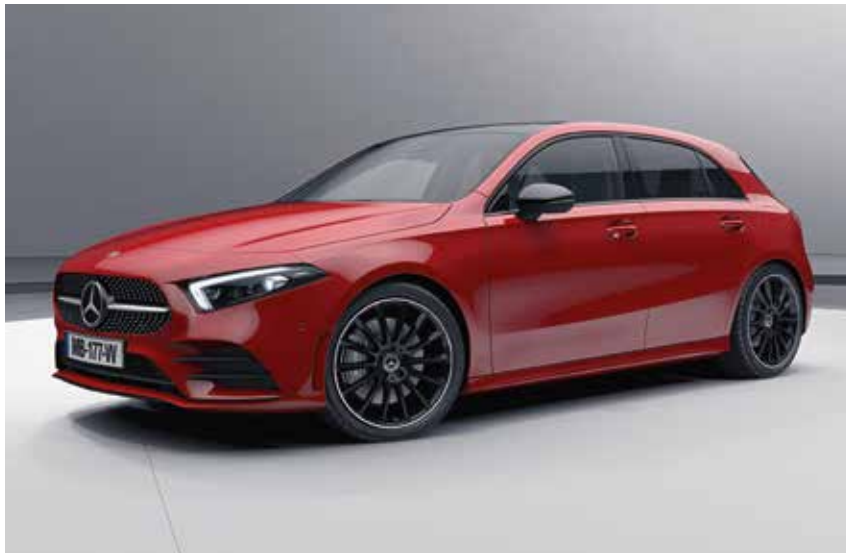
▲ Nouvelle Classe A 200 AMG Line avec Projecteurs MULTIBEAM LED (642), Pack Sport Black (P55), Jantes alliage AMG 48,3 cm (19") en Y (RVK) et Toit ouvrant panoramique (413)

MERCEDES-AMG A 35 4MATIC Accédez à la Performance AMG