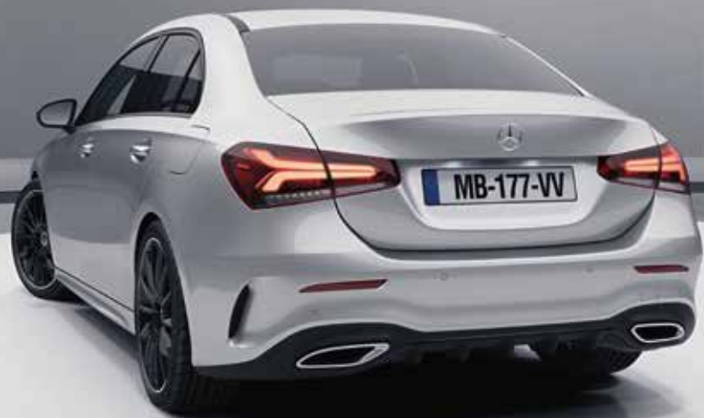
▲ Pack Sport Black (P55) avec jantes alliage AMG 48,3 cm (19") en Y (RVK)