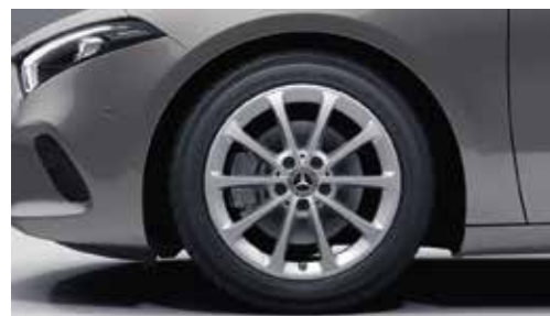
▲ Jantes alliage 43,2 cm (17") à 10 branches

Pour connaître le détail des garnitures en cuir, veuillez vous reporter à la rubrique Peintures et Garnitures