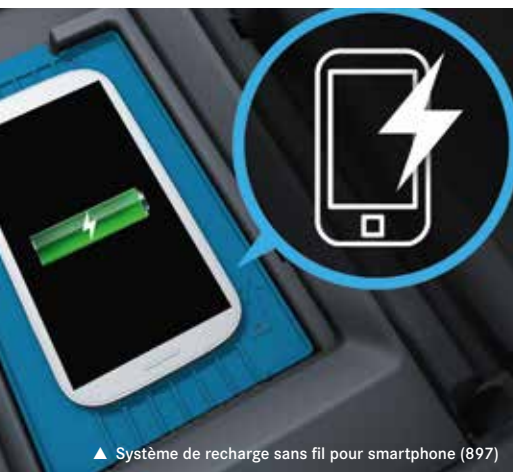
▲ Système de recharge sans fil pour smartphone (897)