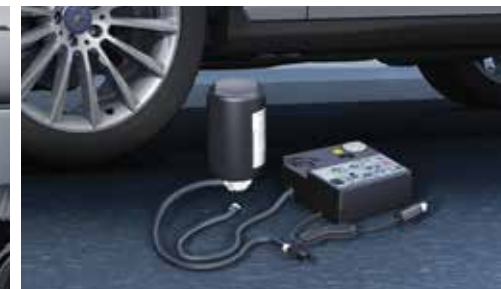
▲ Kit anticrevaison TIREFIT