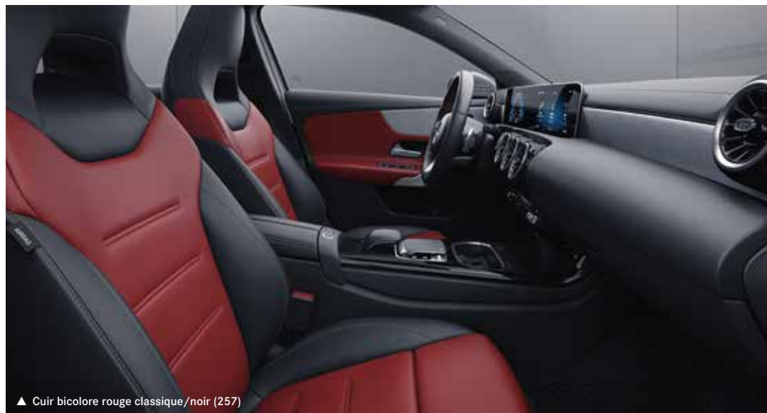
▲ Cuir bicolore rouge classique/noir (257)

Venez découvrir l'ensemble des équipements optionnels disponibles sur notre site internet Mercedes-Benz. https://www.mercedes-benz.fr/passengercars/mercedes-benz-cars/models/a-class