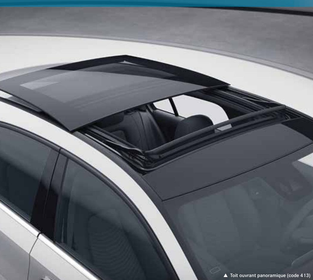
▲ Toit ouvrant panoramique (code 413)