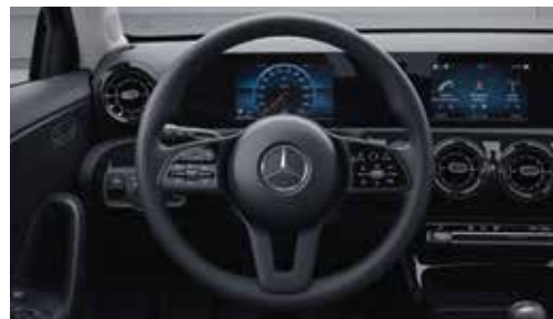
▲ Volant sport multifonction en cuir