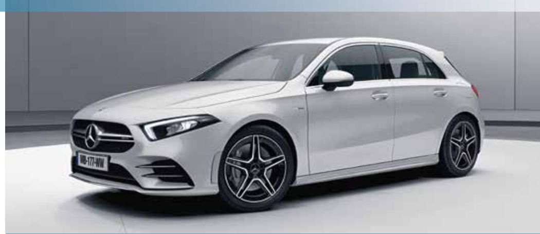
▲ Nouvelle Mercedes-AMG A 35 4MATIC