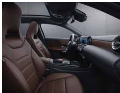
▲ Cuir marron bahia/noir (204A), sièges sport Classe A