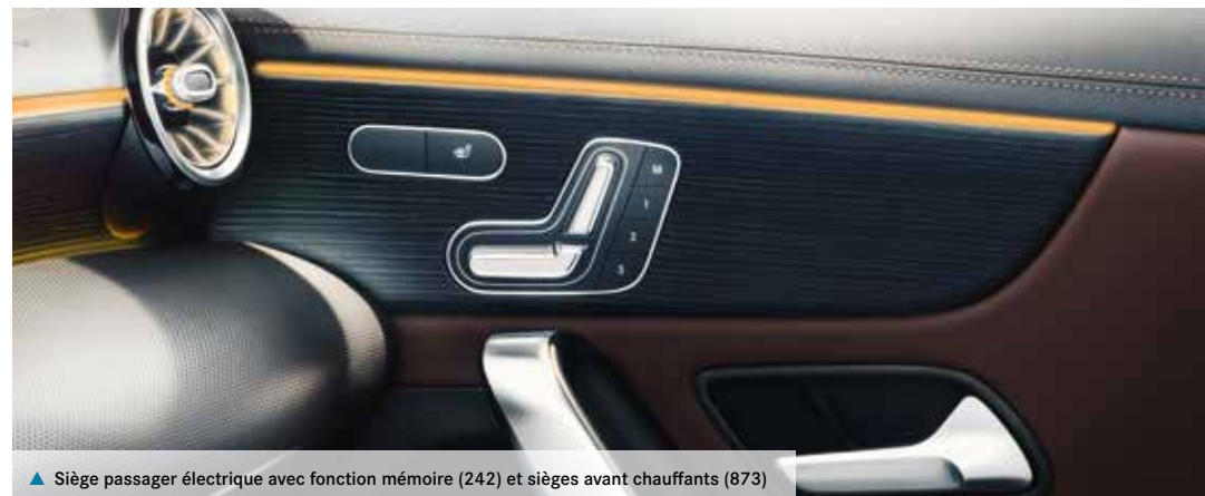
▲ Siège passager électrique avec fonction mémoire (242) et sièges avant chauffants (873)