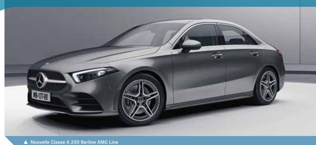
▲ Nouvelle Classe A 200 Berline AMG Line