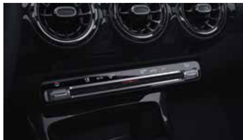
▲ Climatisation THERMATIC

Pour connaître le détail des garnitures en cuir, veuillez vous reporter à la rubrique Peintures et Garnitures