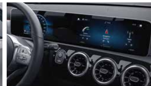
▲ Écran central multimédia de 10"