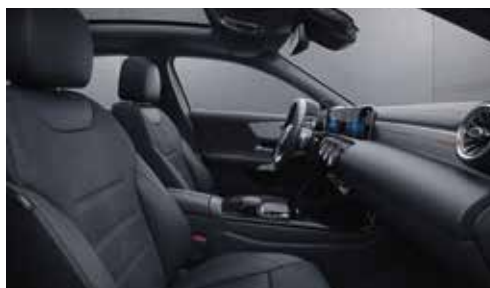
▲ Sièges sport et garniture en similicuir ARTICO/microfibre DINAMICA avec surpiqûres contrastées