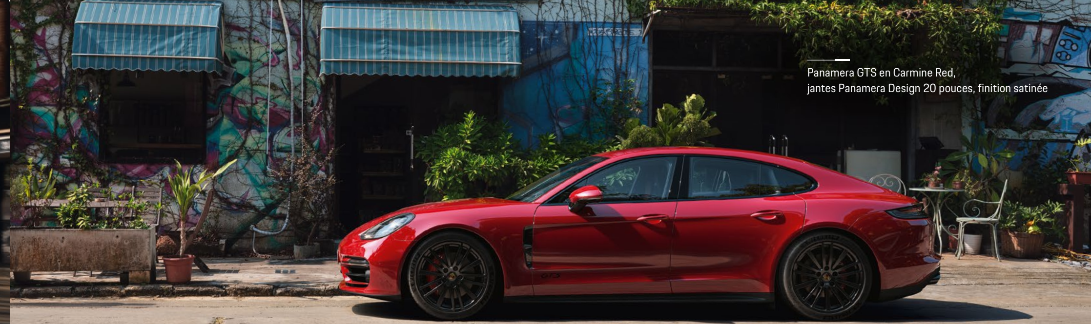
Panamera GTS en Carmine Red, jantes Panamera Design 20 pouces, finition satinée

Les informations concernant la consommation de carburant et d'électricité, les émissions de CO 2 et la classe énergétique sont indiquées en fin de brochure.