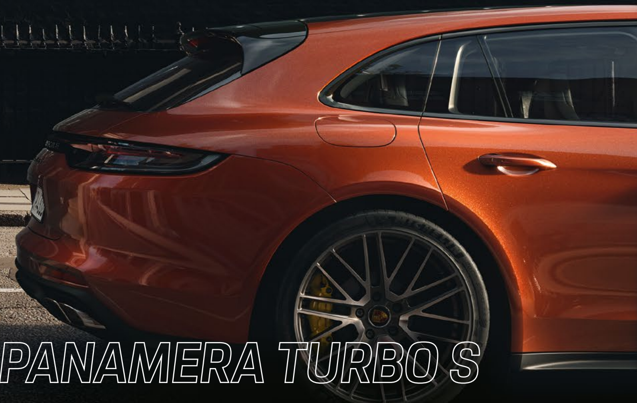
Panamera Turbo S Sport Turismo, en Papaye métallisé, jantes « 911 Turbo Design II » 21 pouces

Les informations concernant la consommation de carburant et d'électricité, les émissions de CO 2 et la classe énergétique sont indiquées en fin de brochure.