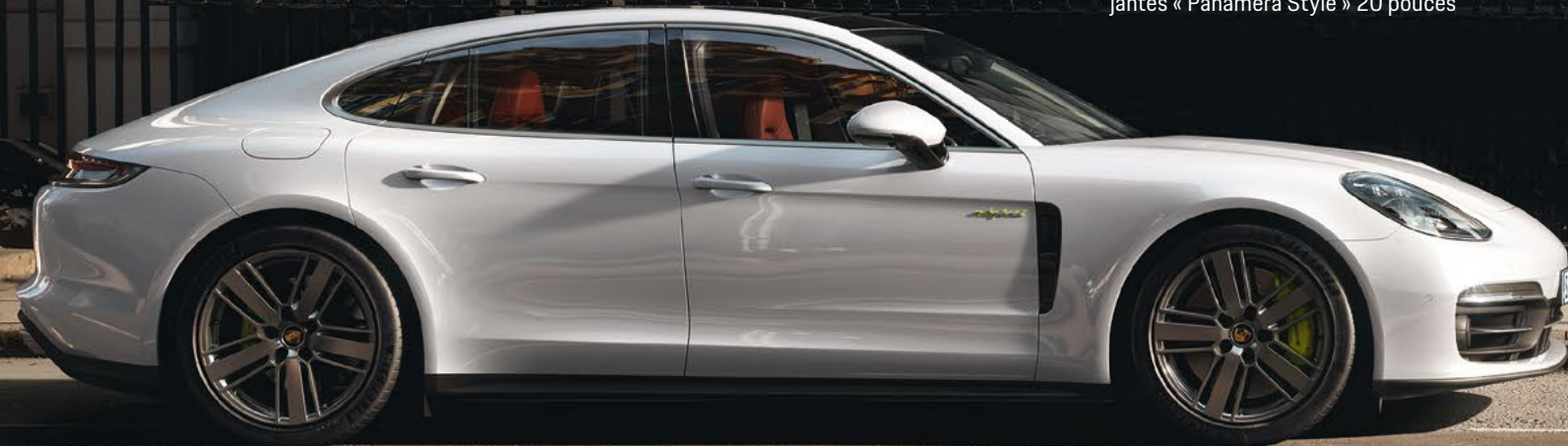
Panamera 4S E-Hybrid, en Blanc Carrara métallisé, jantes « Panamera Style » 20 pouces