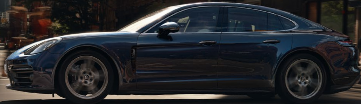
Panamera 4, en Night Blue Metallic, jantes « Panamera Turbo » 20 pouces

Les nouveaux réglages de châssis et la nouvelle génération de jantes 20 et 21 pouces intensifient les sensations de conduite. Porsche Connect relie tous les nouveaux modèles Panamera au monde numérique d'aujourd'hui, et de demain.