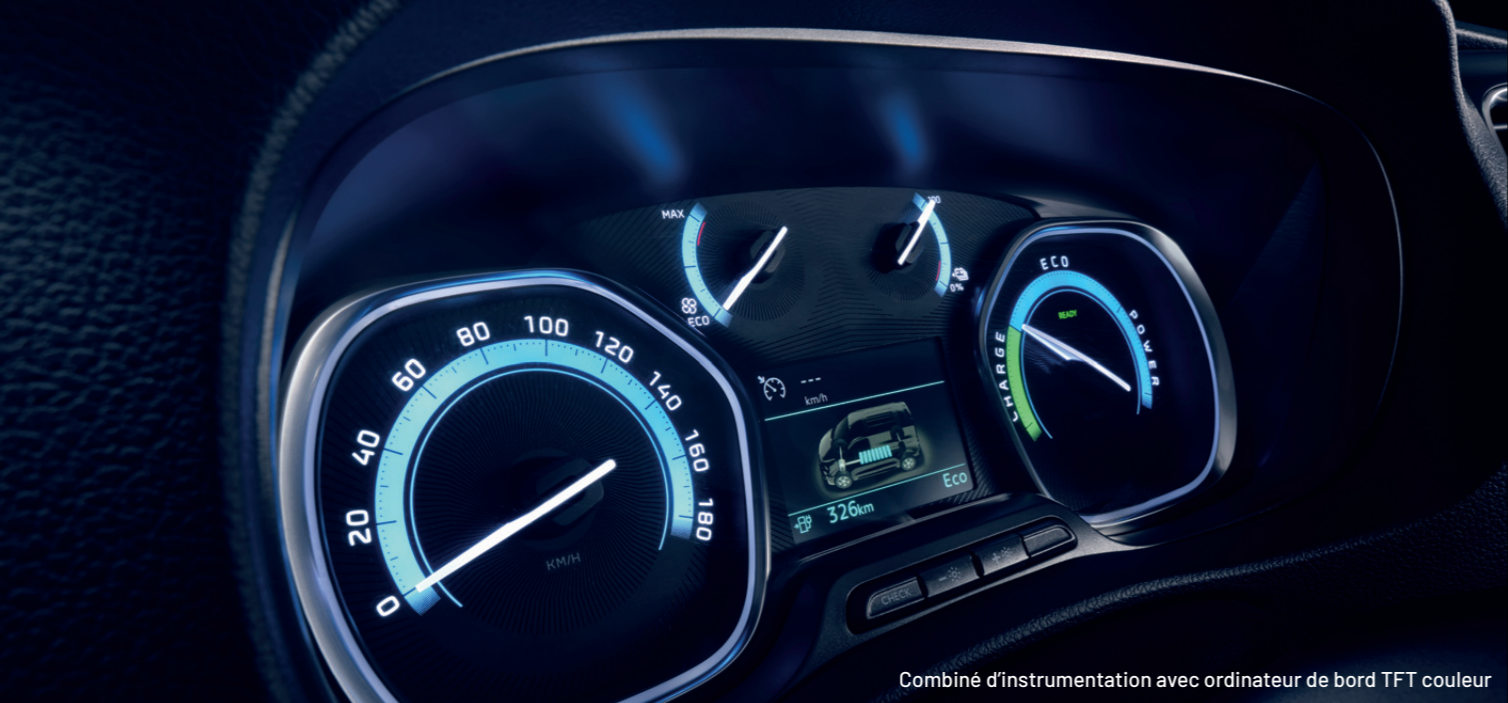
Combiné d'instrumentation avec ordinateur de bord TFT couleur