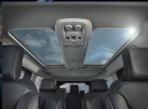
Toit vitré en deux parties occultables séparément