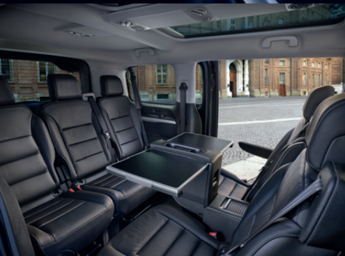
Places arrière face à face avec table coulissante escamotable sur rail (configuration 7 places)