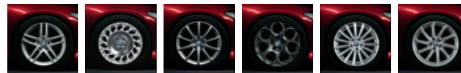
Jantes en alliage 16" Jantes en alliage 16" ECO** Jantes en alliage 17" Jantes en alliage 17" Sport Jantes en alliage 17" Luxury Jantes en alliage 18" Sport

** Uniquement disponibles sur 180 ch AT8 Advanced Efficiency