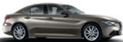
082 - Titane Imola (opt 5DN)