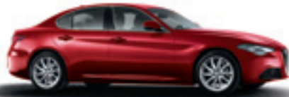
361 - Rouge Competizione (opt 270)*