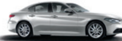
620 - Gris Silverstone (opt 210)