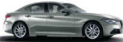
318 - Gris Stromboli (opt 5CC)