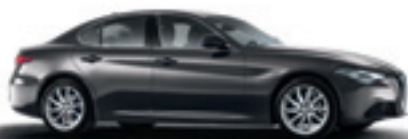
035 - Gris Vesuvio (opt 5CE)