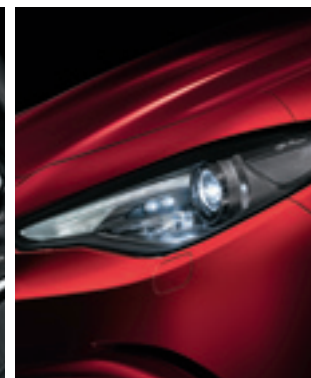
Phares Bi-Xénon 35W directionnels avec feux avant éclairage à LED