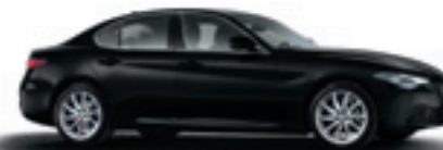
601 - Noir Alfa (opt 5CF)