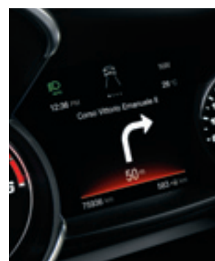
Ordinateur de bord avec écran TFT 7"