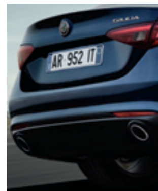
Double sortie d'échappement