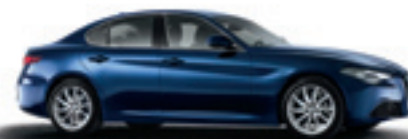
092 - Bleu Montecarlo (opt 5CD)