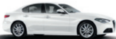
217 - Blanc Alfa (opt 5B2)