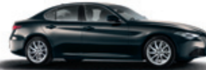
409 - Gris Lipari (opt 5DQ)