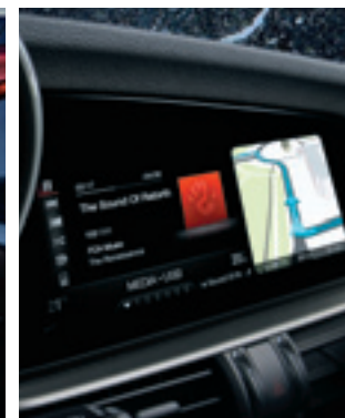
Système de navigation 3D 8" Radio numérique