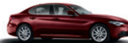
093 - Rouge Monza (opt 5DP)