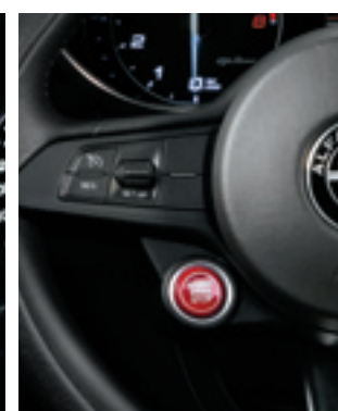
Bouton de démarrage sans clé (Quadrifoglio)