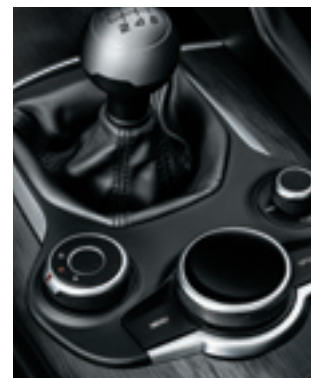
Alfa D.N.A. ÉVOLUÉ et rotary Pad