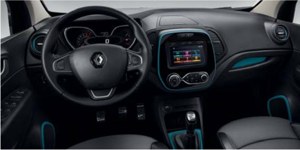
Décors intérieurs bleu ocean