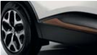
Décors Extérieurs Brun Cappuccino