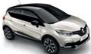
Ivoire (OS)* Toit Noir Étoilé (TE)