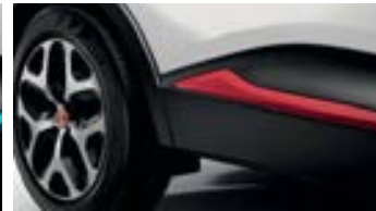
Décors Extérieurs Rouge