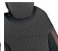
Sellerie déhoussable Caramel