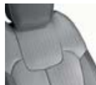
Sellerie TEP / Tissu Gris Chiné