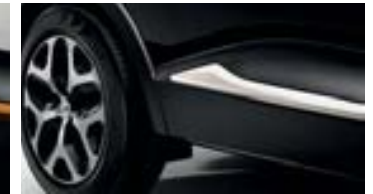
Décors Extérieurs Ivoire