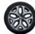
Jante alliage 17" Emotion Diamantée Gris