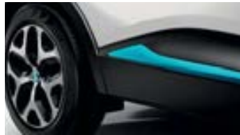
Décors Extérieurs Bleu Pacifique