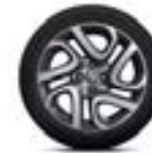
Jante alliage 17" Explore Diamantée Gris