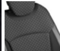
Sellerie déhoussable Ivoire