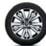
Jante alliage 17" INITIALE PARIS diamantée Noir