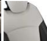
Sellerie fixe Ivoire / Noir