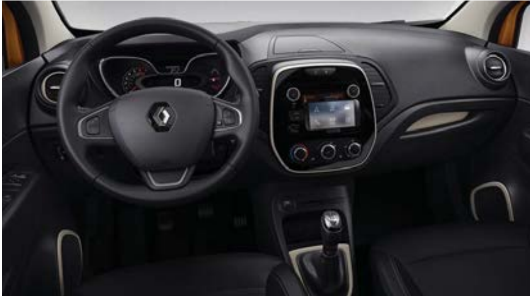
Ambiance intérieure foncée, visuel présenté avec option Radio Connect R&Go