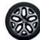
Jante alliage 17" Emotion Diamantée Noir