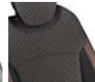
Sellerie déhoussable Caramel