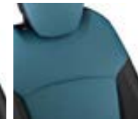
Sellerie fixe Bleu Océan