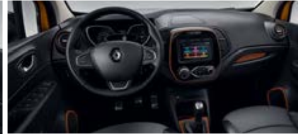
Décors intérieurs Caramel