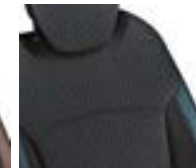
Sellerie déhoussable Bleu Océan