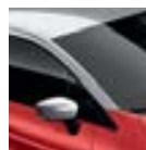
Toit Gris Platine (TE)