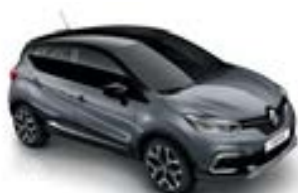
Gris Cassiopée (TE)* Toit Noir Étoilé (TE)