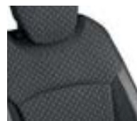
Sellerie déhoussable Ivoire