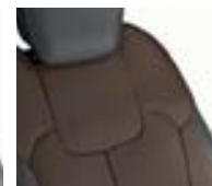
Sellerie TEP / Tissu Brun