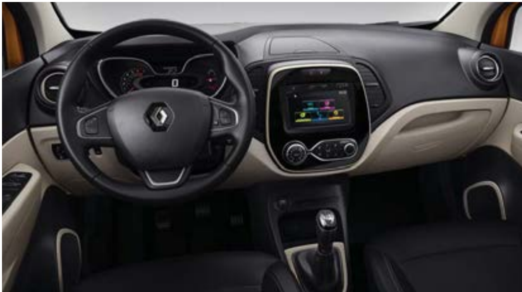
Ambiance intérieure contrastée, visuel présenté avec Pack Confort