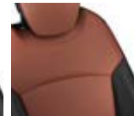
Sellerie fixe Caramel