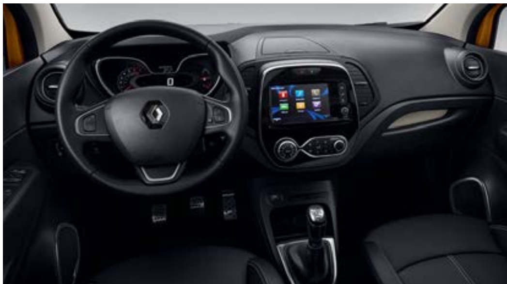
Ambiance intérieure foncée, visuel présenté avec option R-LINK Evolution et sellerie cuir Noir