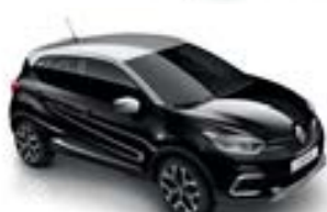
Noir Étoilé (TE)* Toit Gris Platine (TE)