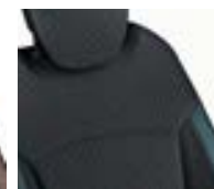
Sellerie déhoussable Bleu Océan