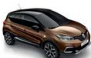
Brun Cappuccino (TE)* Toit Noir Étoilé (TE)