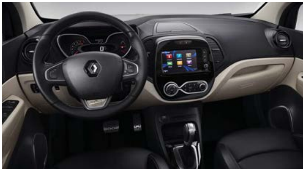
Ambiance intérieure contrastée