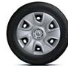
Enjoliveur 16" Extreme