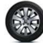
Jante alliage 16" Adventure Diamantée Noir