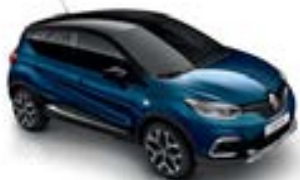
Bleu Océan (TE) Toit Noir Étoilé (TE)