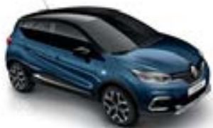
Bleu Marine Fumé (OV) Toit Noir Étoilé (TE)