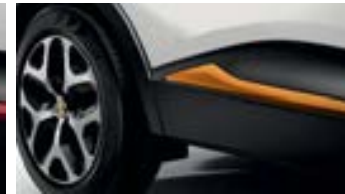
Décors Extérieurs Orange Atacama