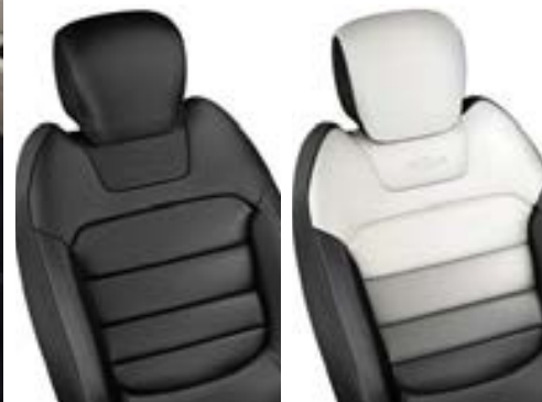
Sellerie en cuir* Nappa Noir Titane