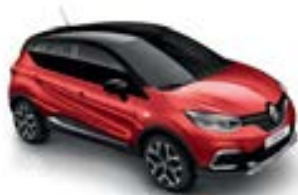
Rouge Flamme (TE) Toit Noir Étoilé (TE)