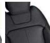
Sellerie Cuir Noir