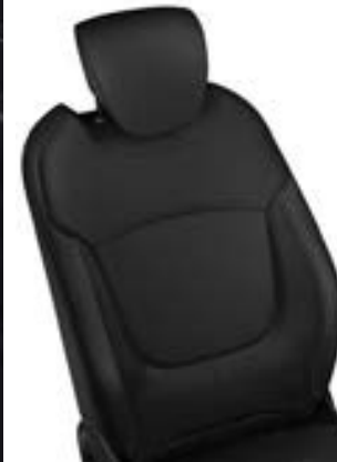
Sellerie tissu Carbone Foncé