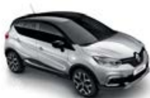
Gris Platine (TE)* Toit Noir Étoilé (TE)