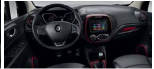
Décors intérieurs Rouge