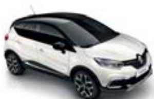
Blanc Nacré (TE)* Toit Noir Étoilé (TE)