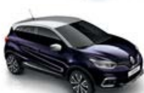
Noir Améthyste (TE)** Toit Gris Platine (TE)