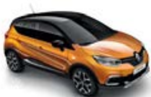
Orange Atacama (TE) Toit Noir Étoilé (TE)