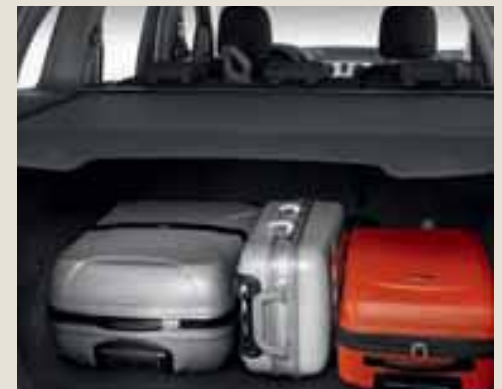
Cache-bagages avec enrouleur.