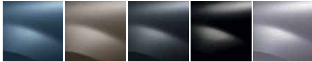
BLEU MINÉRAL (RNF)*