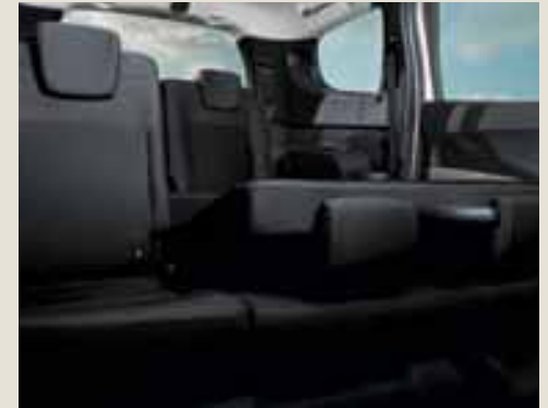
Banquette 2 e rangée 1/3 - 2/3*.