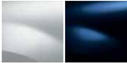
BLANC GLACIER (389)