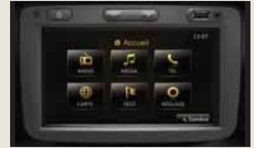
MEDIA NAV avec écran tactile 7".

** D'autres informations sur MEDIA NAV sont disponibles sur www.dacia.fr .