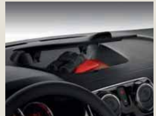
Rangement de haut de planche de bord.