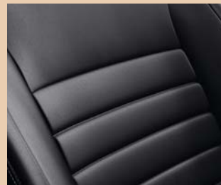
Sellerie cuir** (en option)