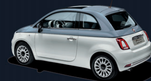
257 Bicolore Primavera