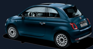
687 Epic Blue