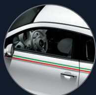
Stickers latéraux drapeau italien 50901914 - 179 €*