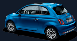
425 Italia Blue