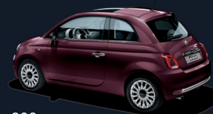
866 Opera Bordeaux