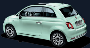
166 Mint Green