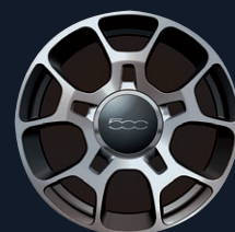
Jantes en alliage 16" Five-O-Spoke 50901669 - 899 €*