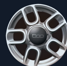
Jantes en alliage 15" Sport 71803944 - 749 €*