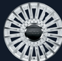
Jantes alliage 16" diamantées blanc mat 50927755 - 799 €*