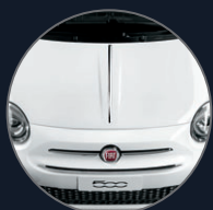
Moulure chromée sur le capot 50901691 - 85 €*