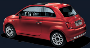
111 Pasodoble Red