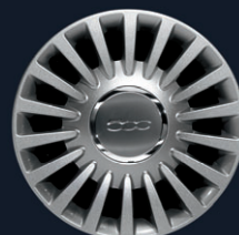
Jantes en alliage 15" Multispoke 71803943 - 749 €*