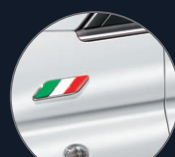
Badges drapeau italien sur ailes avant 50901681 - 45 €*