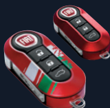
KIT DE 2 COQUES DE CLÉS ITALIE : Rouge avec drapeau italien et rouge métallisé. 71805964 - 42 €*