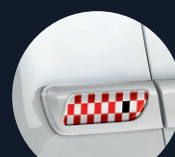
Damier rouge** 50901998 - 65 €*