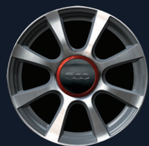
Jantes en alliage 16" By Abarth 50902469 - 899 €*