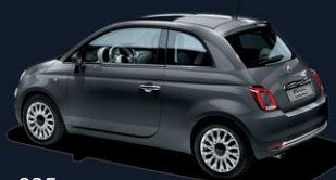
695 Electroclash Grey