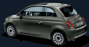
372 Groove Metal Grey