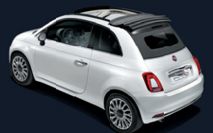
Capote gris astéroïde