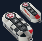
KIT DE 2 COQUES DE CLÉS SPORT : Damier et logo 500. 71805963 - 42 €*