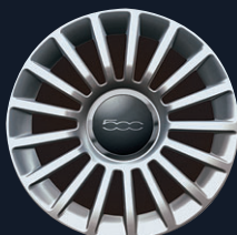
Jantes en alliage 16" Multispoke 71805883 - 899 €*