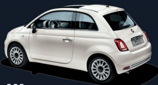
268 Bossanova White