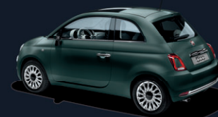
421 Matt Green