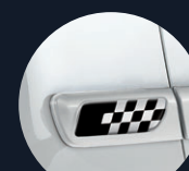
Sport noir** 50901678 - 65 €*