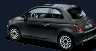
802 Matt Grey