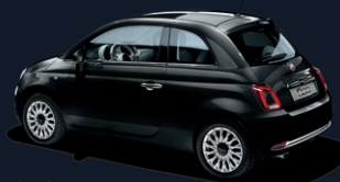
876 Crossover Black