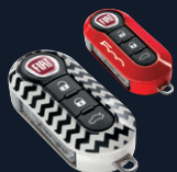
KIT DE 2 COQUES DE CLÉS : Chevron et Coral red. 50927692 - 42 €