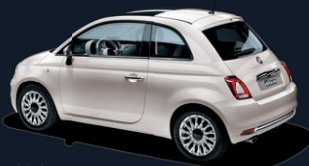
494 Powder Pink