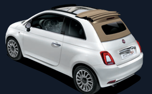
Capote beige lunaire