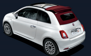
Capote rouge météorite