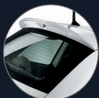
Spoiler arrière 50901672 - 189 €*