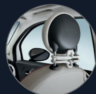
Porte veste sur appuie-tête (coloris ivoire) 50901975 - 49 €*