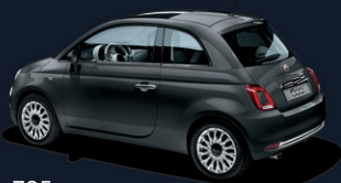
735 Tech-House Grey