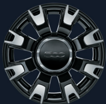
Jantes alliage 14" diamantées noir mat 50927756 - 696 €*