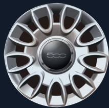
Jantes alliage 15" Original 50901665 - 749 €*