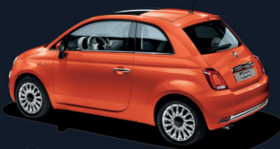
562 Sicilia Orange