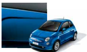
425 - Italia Blue