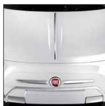
Moulure chromée sur capot. Référence 50901691. Prix TTC (hors pose) : 85 € A-barre avant chromée. Référence 50901674. Prix TTC (hors pose) : 149 €