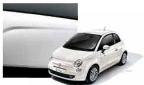
268 - Bossa Nova White