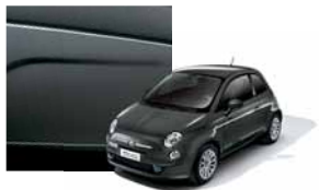
735 - Tech House Grey