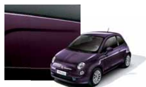
528 - Chillout Purple