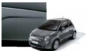
695 - Electroclash Grey