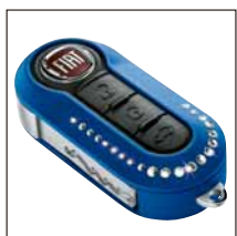
Coque de clé Swarovski coloris bleu. Référence 71805594. Prix TTC (hors pose) : 65 €