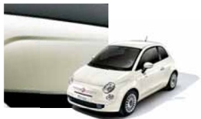
227 - Ice White