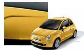
712 - Countryopolitan Yellow