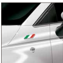
Badge drapeau italien (lot de 2). Référence 50901681. Prix TTC (hors pose) : 45 €