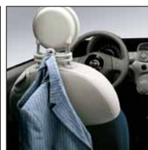
Porte-veste multifonctions sur appuie-tête. Référence 50901975 (ivoire) ou 50901708 (noir). Prix TTC (hors pose) : 49 €