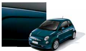
687 - Epic Blue