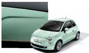
166 - Mint Green