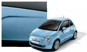
952 - Soul Blue