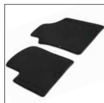
Tapis de sol velours avec broderie 500 noire. Référence 71806661. Prix TTC (hors pose) : 56 €