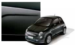
823 - Gris / Noir