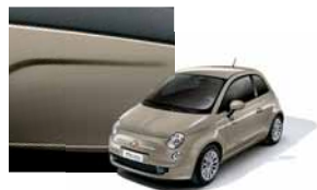
231 - New Age Cream