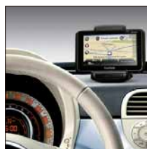
GPS Blue&Me™ TomTom™ Live : écran tactile 4,3", cartographie Europe 45 pays, Bluetooth™, 1 an de services Live inclus, support intégré. Référence 71806238. Prix TTC (hors pose) : 370 €