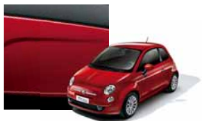
111 - Pasodoble Red