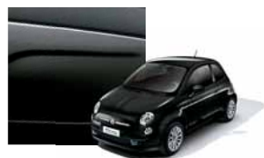
876 - Crossover Black