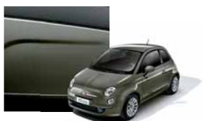
372 - Groove Metal Grey